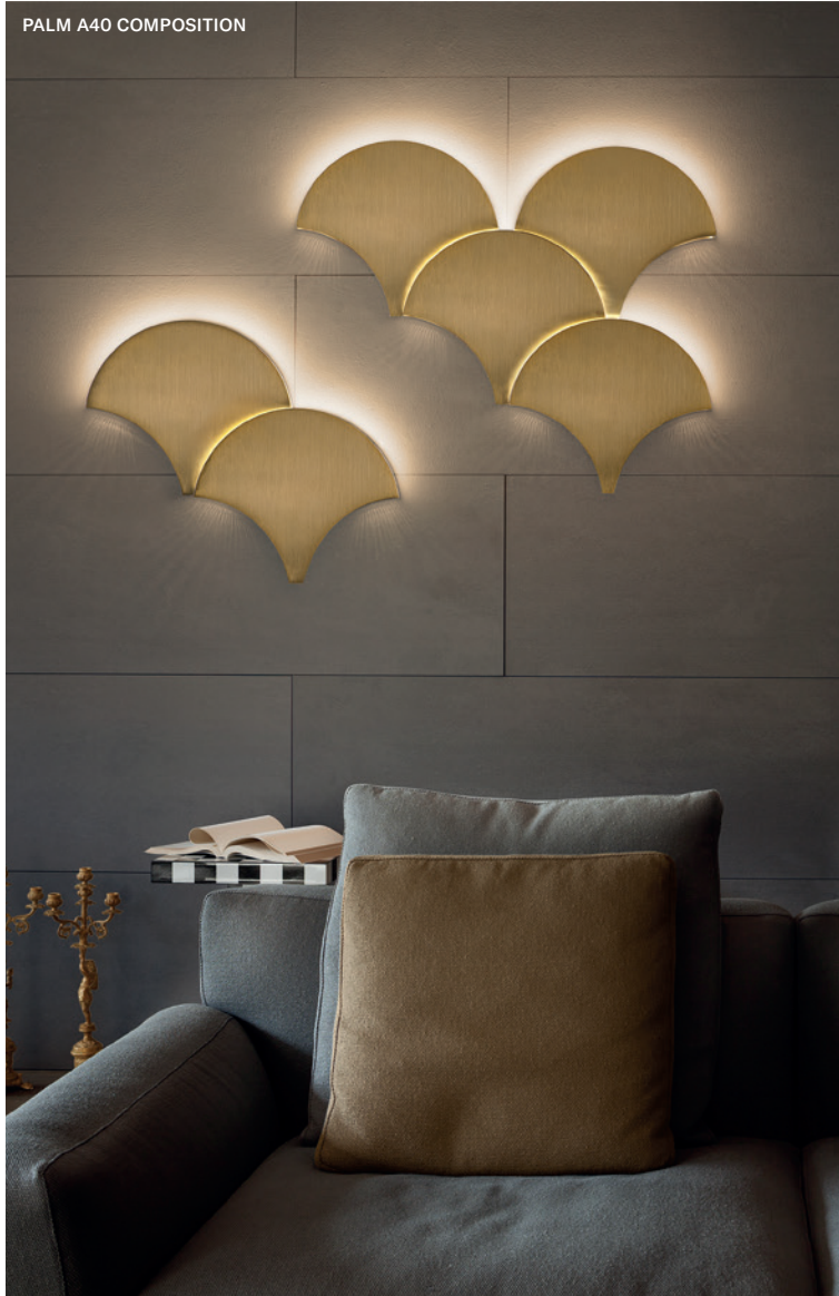
PALM A40 COMPOSITION