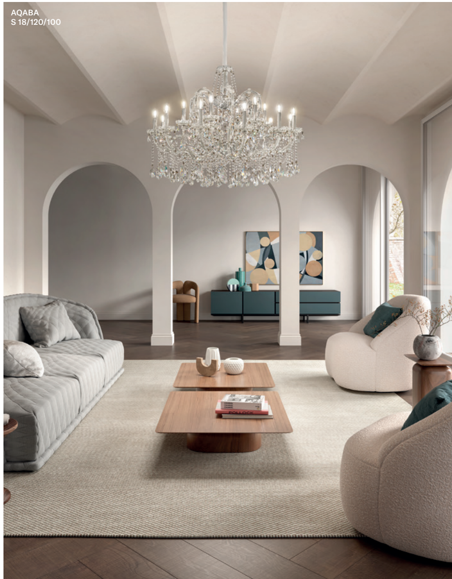
AQABA S 18/120/100