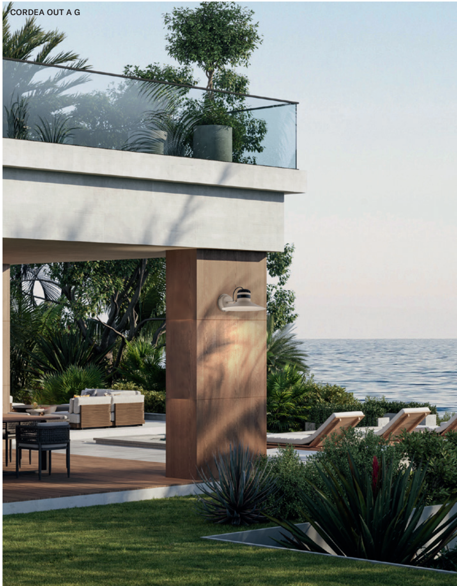
CORDEA OUT A G