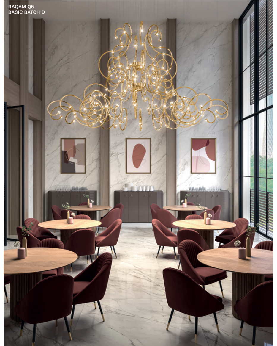
RAQAM Q5 BASIC BATCH D