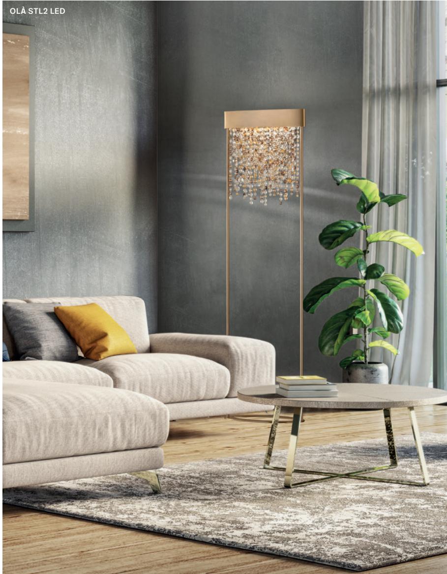
OLÀ STL2 LED