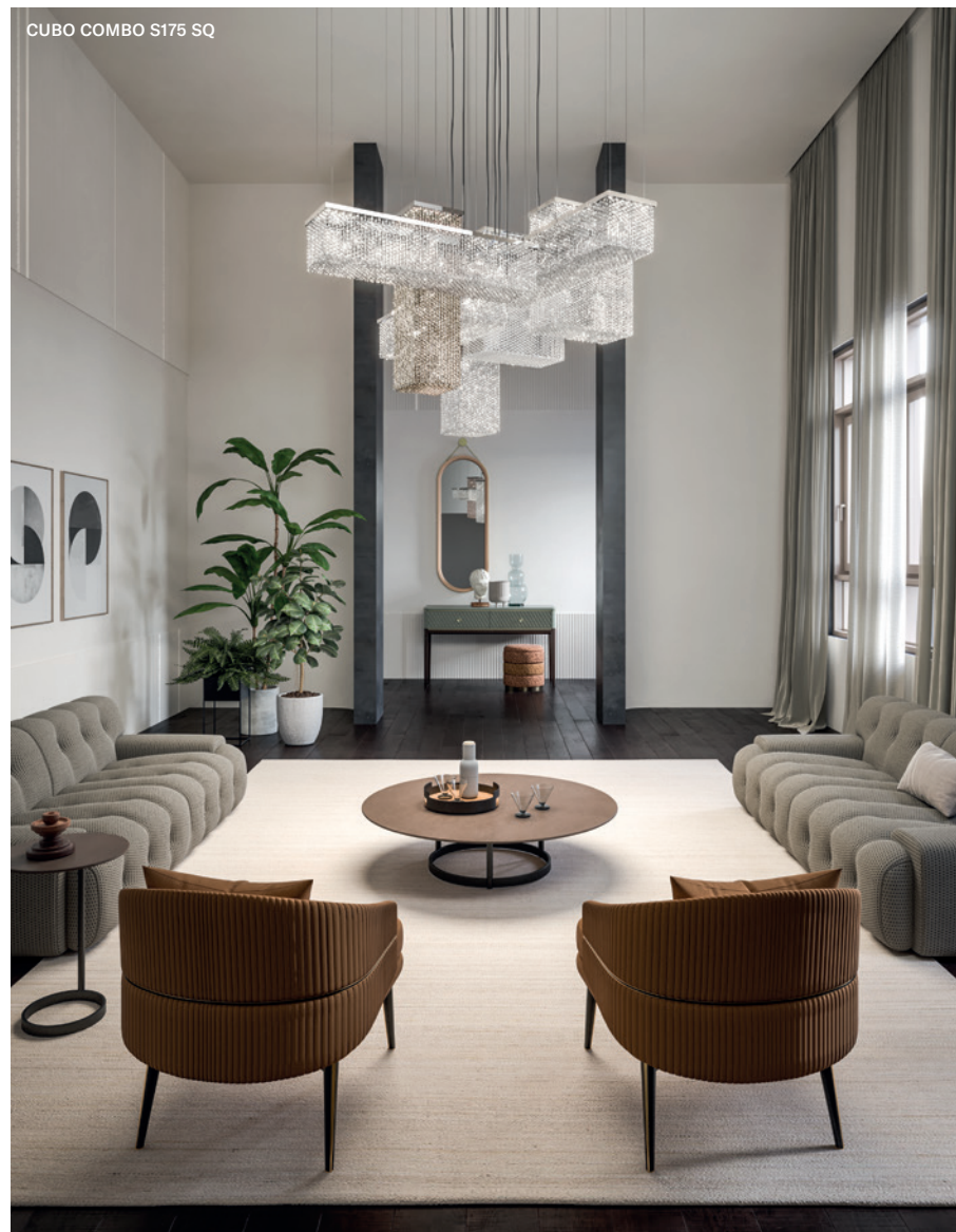
CUBO COMBO S175 SQ