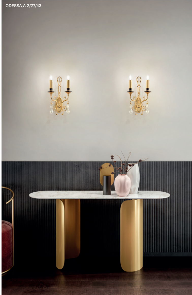
ODESSA A 2/27/43