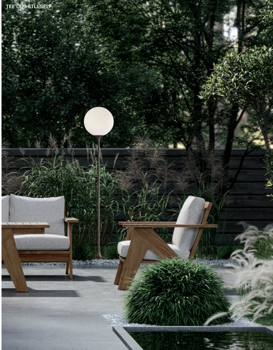
TEE OUT STL1 SELF