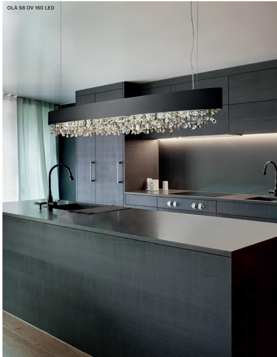
OLÀ S6 OV 160 LED

SUSPENSION CEILING APPLIQUE TABLE LAMP FLOOR LAMP