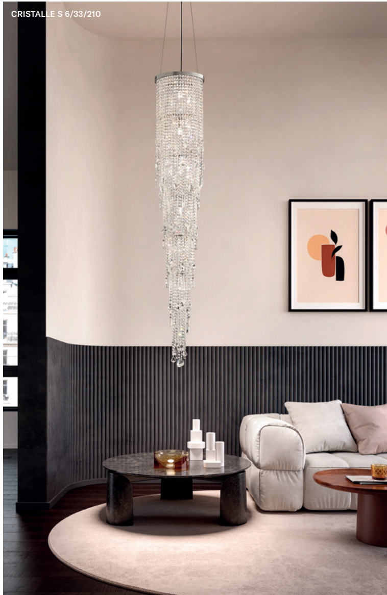
CRISTALLE S 6/33/210