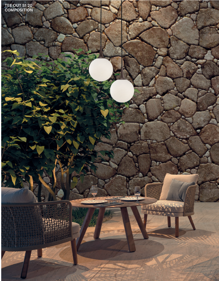
TEE OUT S1 20 COMPOSITION