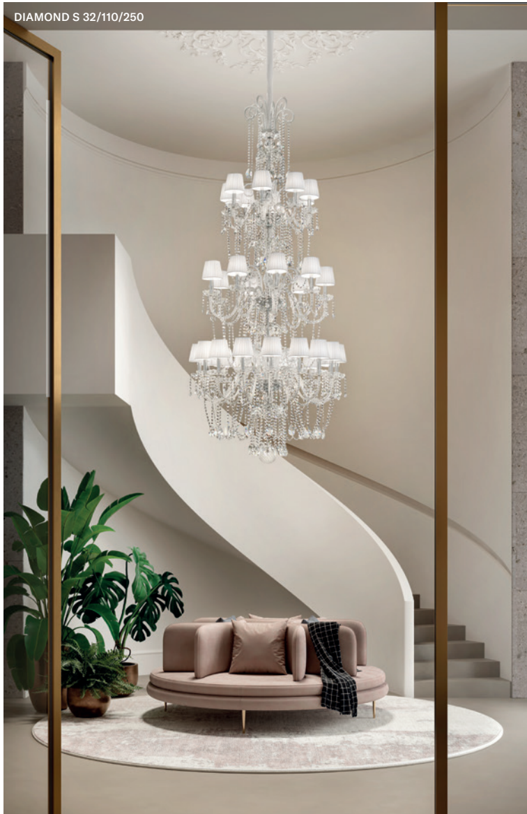
DIAMOND S 32/110/250