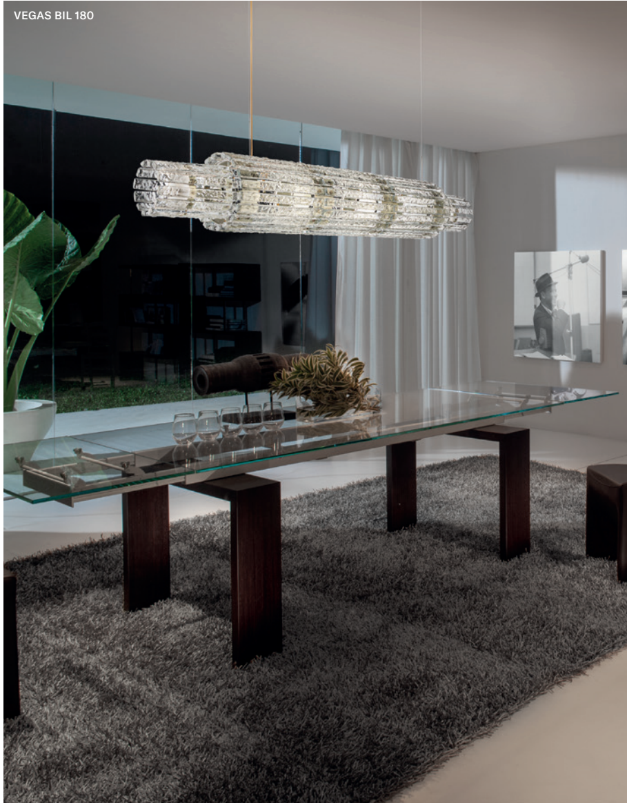
VEGAS BIL 180