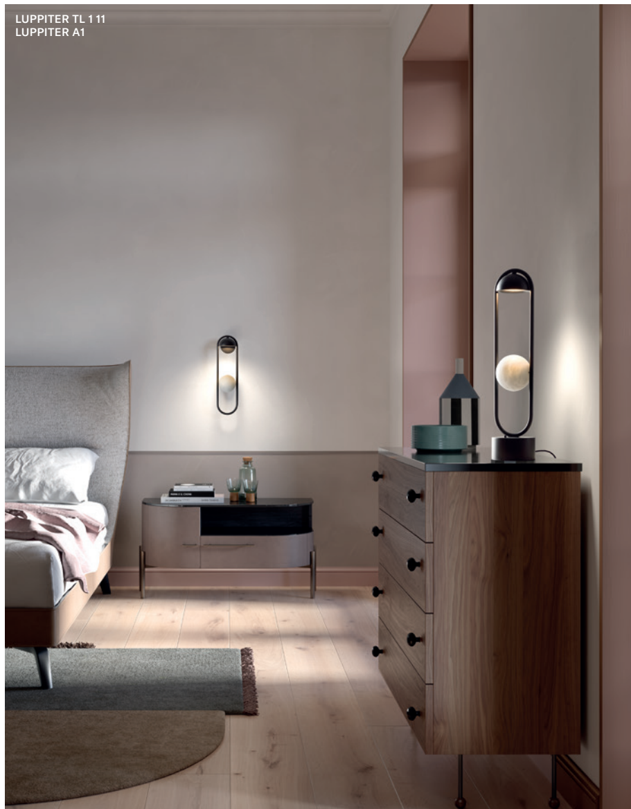
LUPPITER TL 1 11 LUPPITER A1