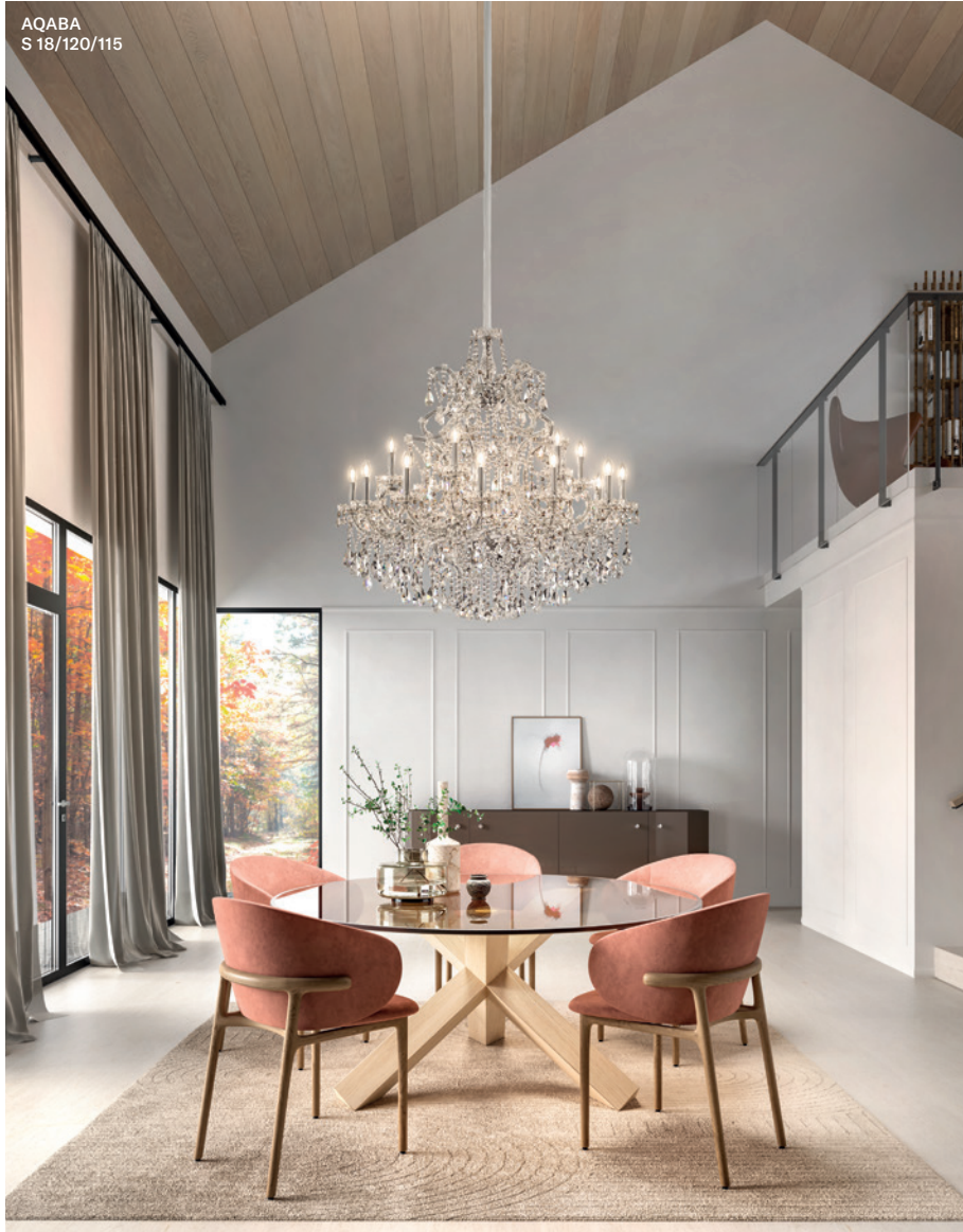
AQABA S 18/120/115