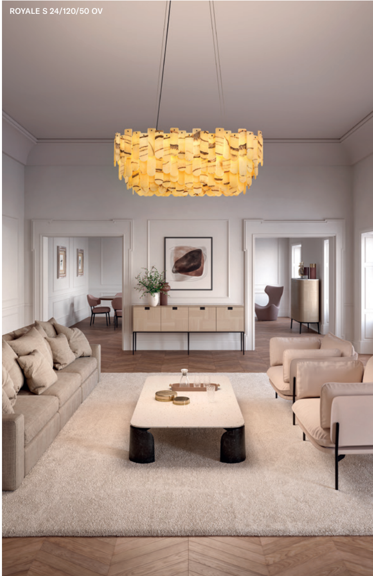
ROYALE S 24/120/50 OV