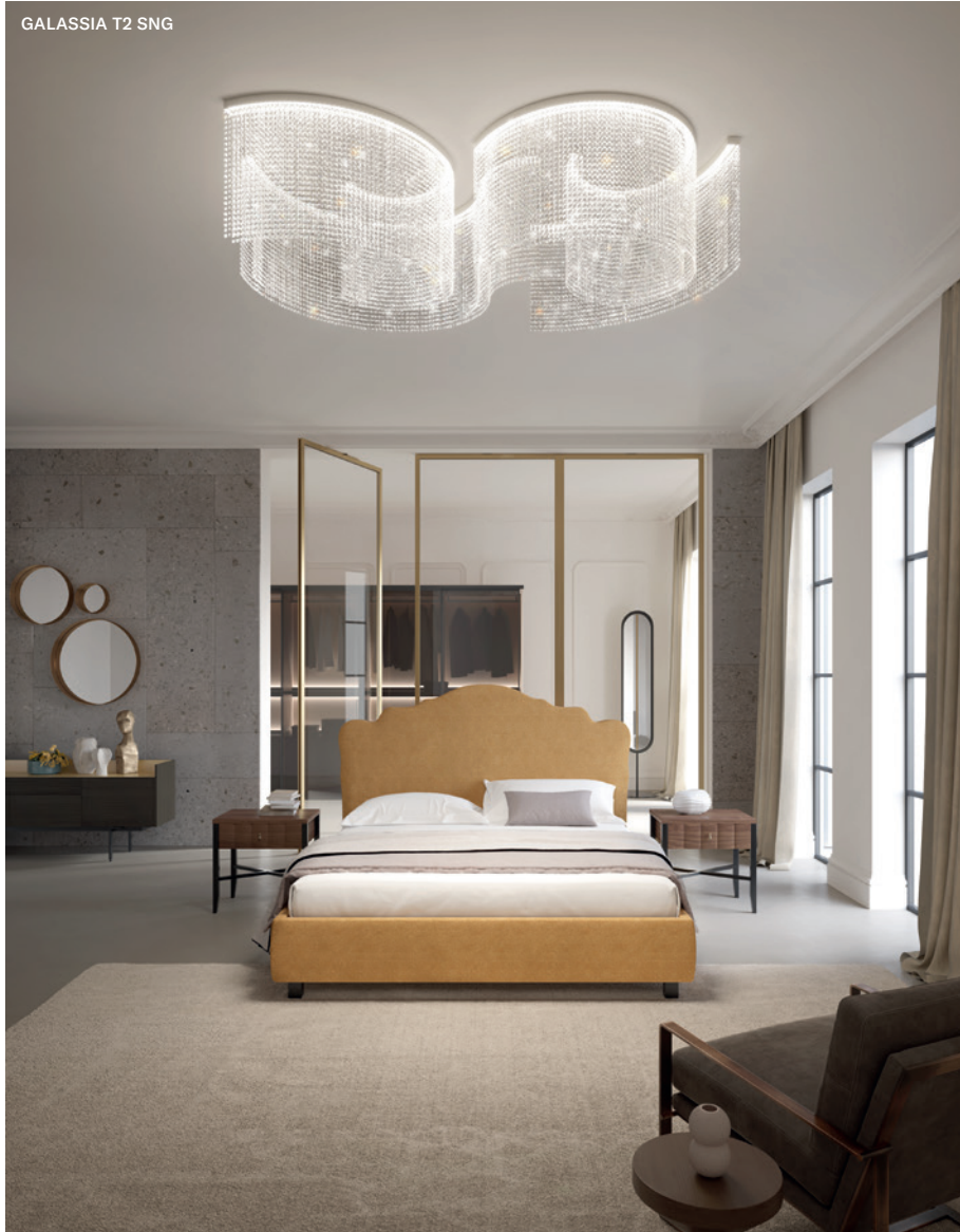
GALASSIA T2 SNG