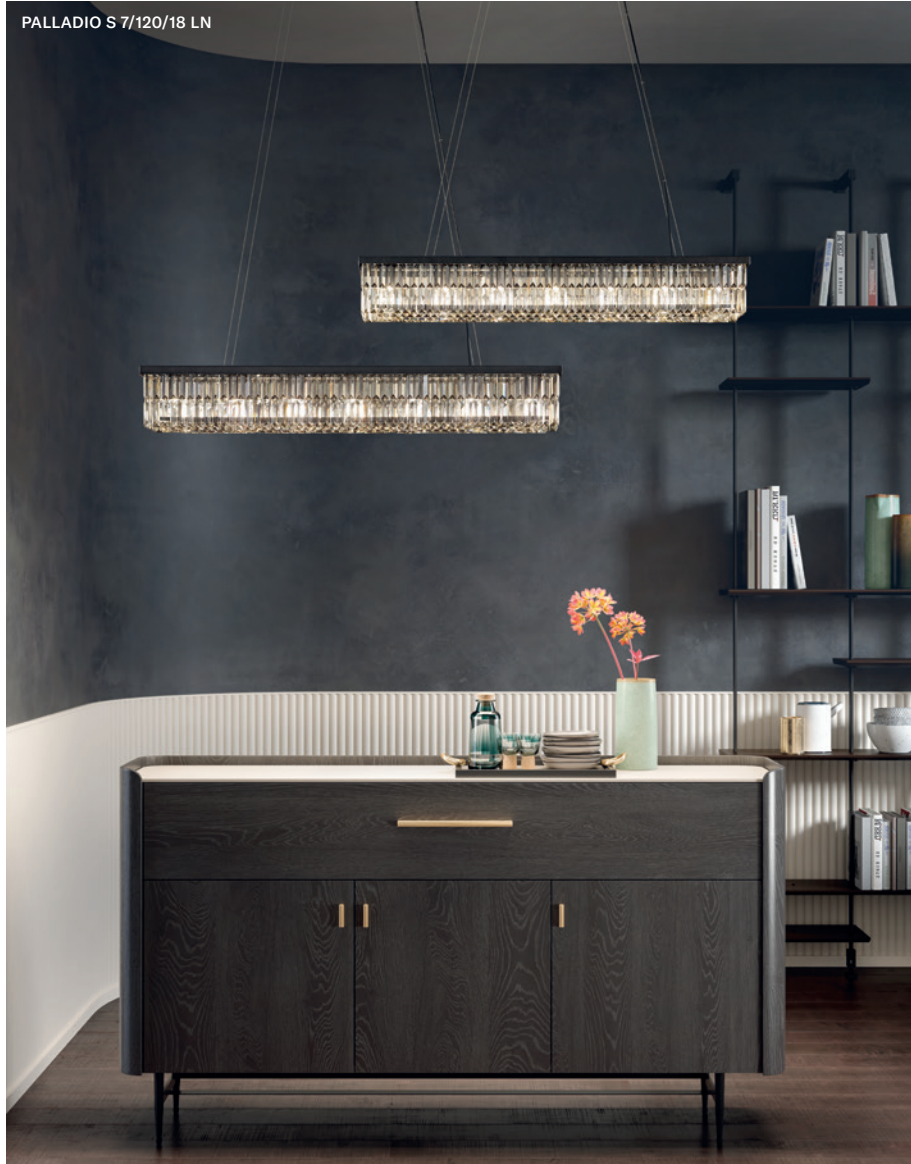
PALLADIO S 7/120/18 LN