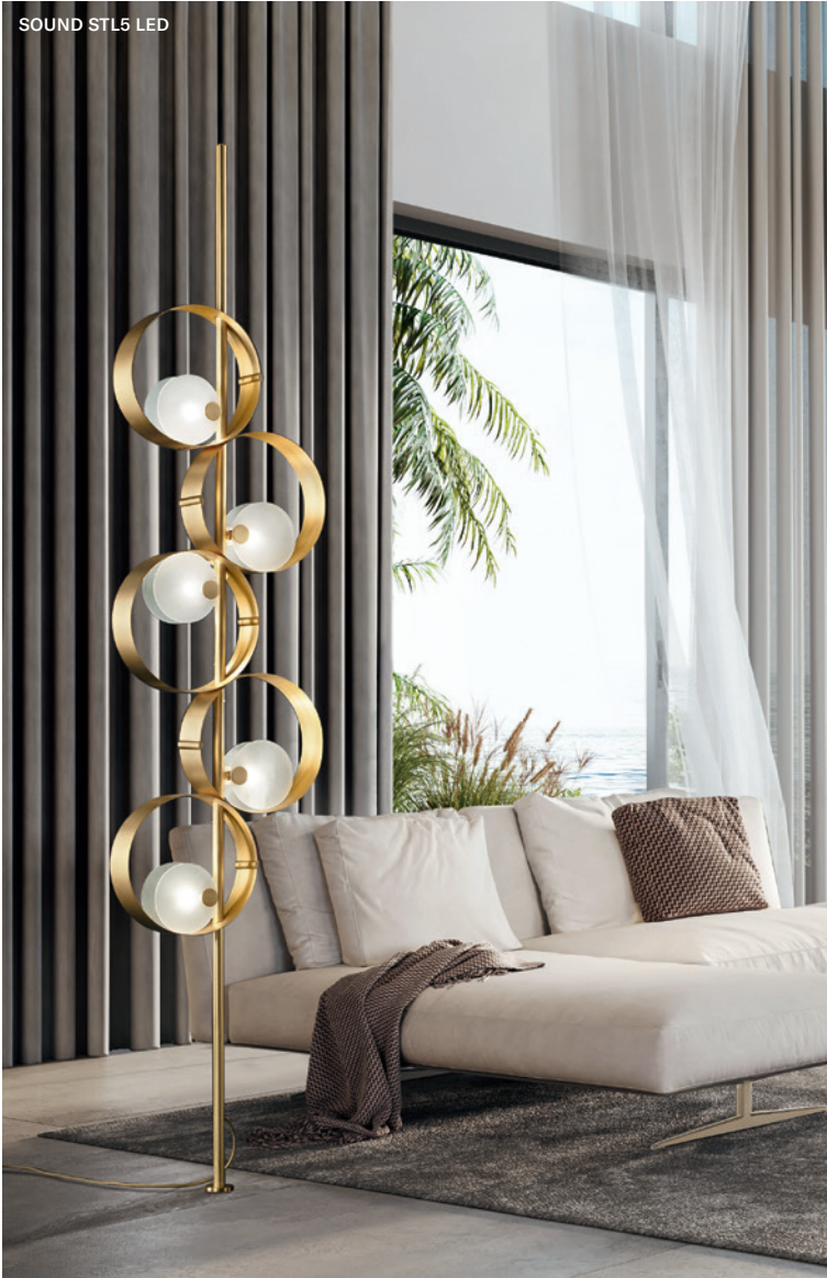
SOUND STL5 LED